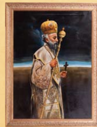
Μακάριος με άμφια αρχιερατικά, λάδι σε καμβά Makarios with hierarchical vestments, oil on canvas