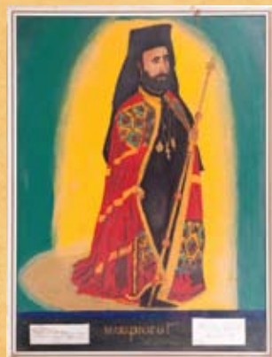
Α. Μ. Τερέντις (σε ηλικία 14 ετών), Μακάριος Γ΄ , 2.3.1963, A. M. Terentis (age 14), Makarios III , 2.3.1963, oil on canvas