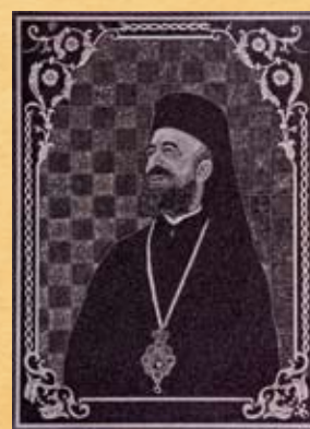
Προσωπογραφία Αρχ. Μακαρίου Γ΄, χαρακτηριστική σε μαύρο μάρμαρο, Αρμενία, 1986. Portrait of the Archbishop Makarios III, engraving on black marble, Armenia 1986