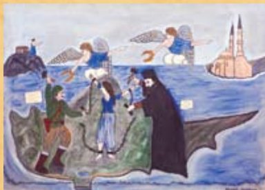
Χρ. Πάφιος, Μακάριος και Γρίβας ελευθερώνουν την Κύπρο , λάδι σε καμβά Chr. Pafios, Makarios and Grivas setting free Cyprus , oil on canvas