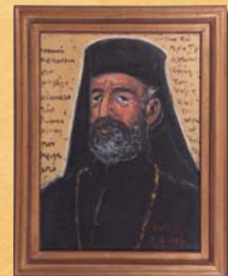
Δ. Άνθης, Μακάριος , 1977, λάδι σε χαρτόνι D. Anthiis, Makarios , 1977, oil on board