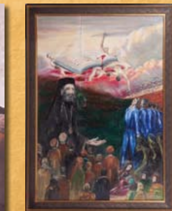
Ε. Αντωνιάδου, Η Ιστορία γράφεται με αίμα , λάδι σε καμβά E. Antoniadou, History written in blood , oil on canvas