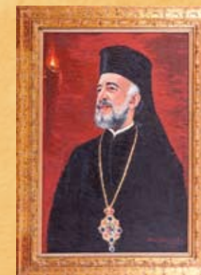
Ν. Νικολαΐδης, Προσωπογραφία Αρχιεπισκόπου Μακαρίου Γ΄ , 1976, λάδι σε καμβά N. Nicolaidis, Portrait of Archbishop Makarios III , 1976, oil on canvas