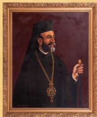
Ν. Αντωνιάδης, Αρχιεπίσκοπος Μακάριος Γ΄ , 1960-61, λάδι σε καμβά N. Antoniadis, Archbishop Makarios III , 1960-61, oil on canvas