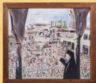
Κ. Αβρααμίδης, Ο Μακάριος χαιρετίζει τα πλήθη (επιστροφή από την εξορία) , λάδι σε καμβά K. Avraamides, Makarios welcomes the crowds (return from exile) , oil on canvas