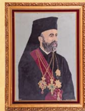
Σ. Τύμβιου, Αρχιεπίσκοπος Μακάριος Γ΄ , 1967, κέντημα S. Tymniou, Archbishop Makarios III , 1967, knitted artwork