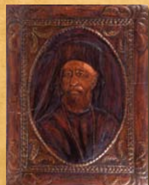
Μ. Κασιμάτης, Ο Κύπριος Μακάριος , ορειχάλκος M. Kasimatis, Makarios of Cyprus , brass