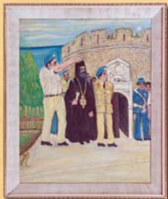
Κ. Αβρααμίδης, Ο Μακάριος εξορίζεται , λάδι σε καμβά K. Avraamides, Makarios is exiled from Cyprus , oil on canvas