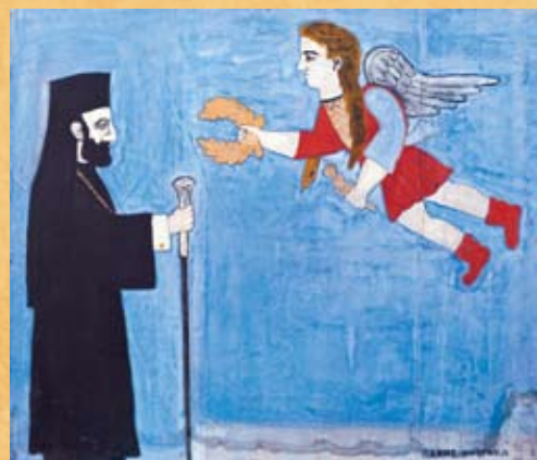
Χρ. Πάφιος, Ο Μακάριος λαμβάνει στέφανον δόξης , λάδι σε καμβά Chr. Pafios, Makarios receives a crown of glory , oil on canvas