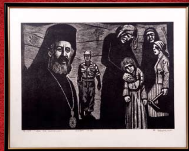
Κ. Αβερκίου, Δεν θα ενδώσουμε , 1976, χαρακτικό 19/50 K. Averkiou, We will not give up , 1976, engraving 19/50