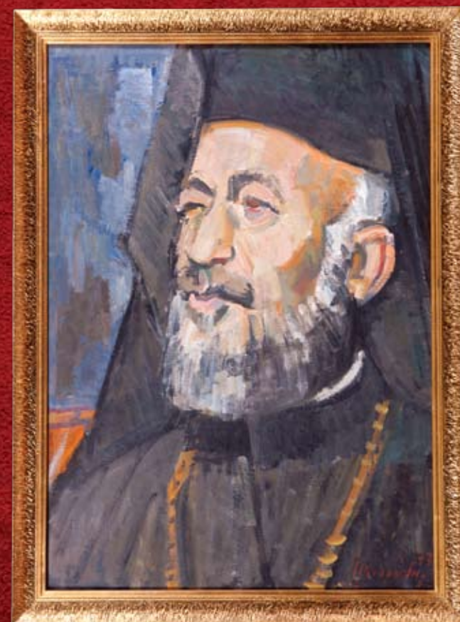
Γ. Μαυροΐδης, Μακάριος , 1977, λάδι σε καμβά G. Mavroides, Makarios , 1977, oil on canvas

Αίθουσα Προσωρινών Εκθέσεων Βυζαντινού Μουσείου Ιδρύματος Αρχιεπισκόπου Μακαρίου Γ΄, Λευκωσία 19 Ιανουαρίου - 19 Φεβρουαρίου 2011