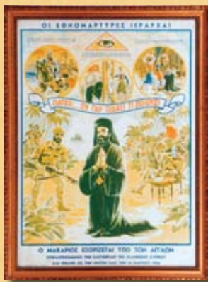
Β. Παπαχρυσάνθου, Οι Εθνομάρτυρες Ιεράρχες: Ο Μακάριος εξορίζεται από τους Άγγλους , 1957, έγχρωμη λιθογραφία V. Papachrysanthou, The martyr Hierarchs: Makarios in exile by the British , 1957, print