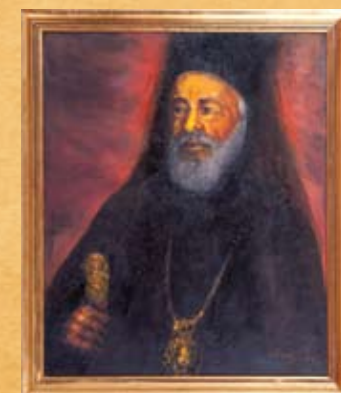
Ο Αρχιεπίσκοπος Μακάριος Γ΄, λάδι σε καμβά Archbishop Makarios III, oil on canvas