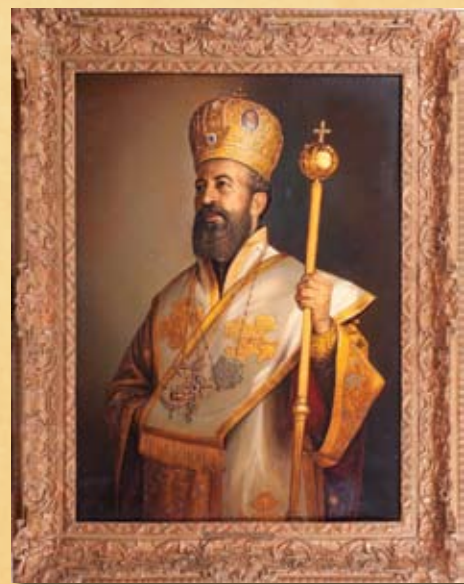
Μ. Ancelme, Αρχιεπίσκοπος Μακάριος με μίτρα και ακήπιρο , 1966, λάδι σε καμβά M. Ancelme, Archbishop Makarios with miter and scepter , 1966, oil on canvas