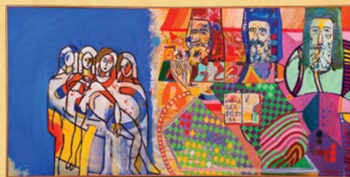
Π. Σιας, Σύνθεση Pietà , λάδι σε καμβά - P. Stass, Composition Pietà , oil on canvas