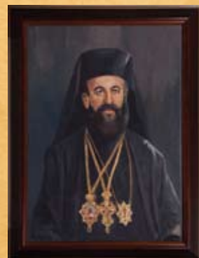
Ο Αρχιεπίσκοπος Μακάριος Γ΄ σε νεαρή ηλικία, λάδι σε καμβά Archishop Makarios III in young age, oil on canvas