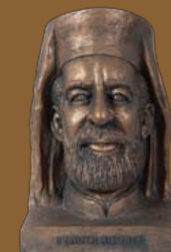
Χάρης, Εθνάρχης Μακάριος Γ΄ , 1997 Charis, Ethnarch Makarios III , 1997

Ο Μακάριος αγάπησε το λαό του και αγωνίστηκε για την κατάφαση της ελευθερίας του και για την επιβίωσή του. Αγωνίστηκε ακόμη για την πνευματική και πολιτιστική άνοδο του λαού του. Οι εργάτες των γραμμάτων και των τεχνών βρήκαν στο πρόσωπό του έναν ένθερμο υποστηρικτή. Δεν είναι, λοιπόν, τυχαίο που η προσωπικότητα και το έργο του ενέπνευσαν πολλούς από αυτούς.