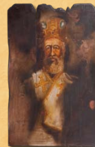
Α. Χαρολαμπιδής, Ο Μακάριος με λειτουργικά άμφια , 1975, λάδι σε ξύλο A. Charalambides, Makarios with liturgical garments , 1975, oil on wood