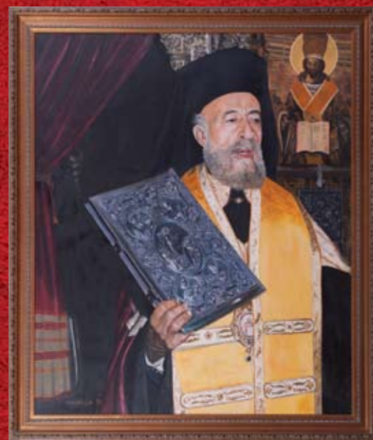
Μ. Καμάσσης, Ο Μακάριος εν ώρα Λειτουργίας , 1978, λάδι σε καμβά M. Camassa, Makarios during Mass , 1978, oil on canvas