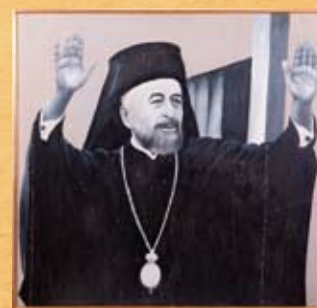
Άγνωστος ζωγράφος από το Ζαΐρ, Μακάριος , λάδι σε καμβά Unknown artist from Zaire, Makarios , oil on canvas