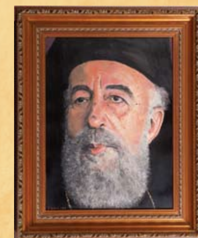
Μ. Καμάσας, Ο Αρχιεπίσκοπος Μακάριος , 1978, λάδι σε καμβά M. Camassa, Archbishop Makarios , 1978, oil on canvas