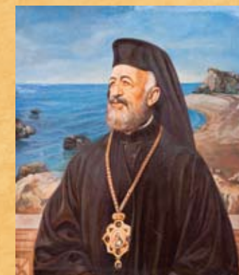
Κ. Ταμανός, Μακάριος στην Πέτρα του Ρωμιού , 1984, λάδι σε καμβά K. Tamas, Makarios in Petra tou Romiou , 1984, oil on canvas