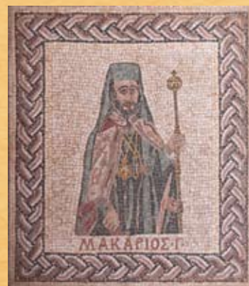
Α.Μ. Ταπακούλλης, Αρχιεπίσκοπος Μακάριος Γ΄ , 1968, ψηφιδωτό Α. Μ. Tapaoullis, Archbishop Makarios III , 1968, mosaic