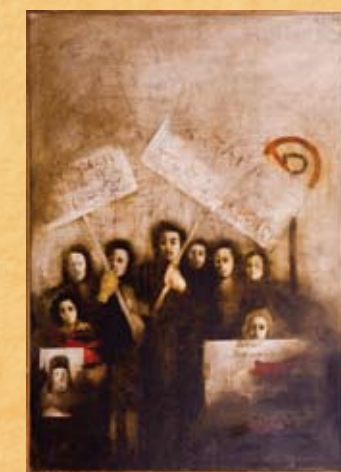
Α. Χαρολαμπιδής, Πανό - Διαδήλωση , 1975, λάδι σε καμβά A. Charalambides, Banners - Demonstration , 1975, oil on canvas