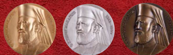
Ν. Κοτζαμάνης, Χρυσό, αργυρό και χάλκινο μετάλλιο Αρχιεπισκόπου Μακαρίου Γ΄ , 1996 N. Kotzamanis, Gold, silver and bronze medal of the Archbishop Makarios III , 1996

Επιμέλεια έκθεσης: Δρ. Ιωάννης Ηλιάδης Κείμενο: Δρ. Ελένη Νικήτα, Μετάφραση κειμένου: Ρέα Φραγκοφίνου, Σχεδιασμός: Δώρας Κακουλλής Curator: Dr Ioannis Eliades Text: Dr Eleni Nikita, Translation: Rhea Frangofinou, Design: Doros Kakoullis